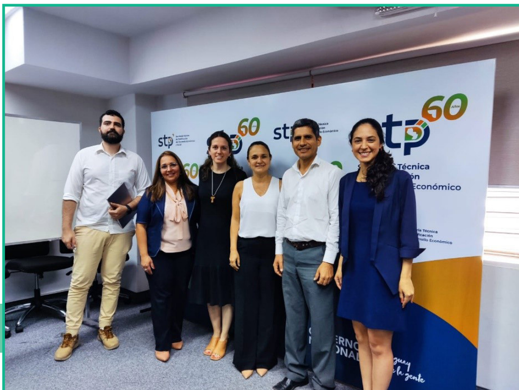
Reunión STP 2022-12-22