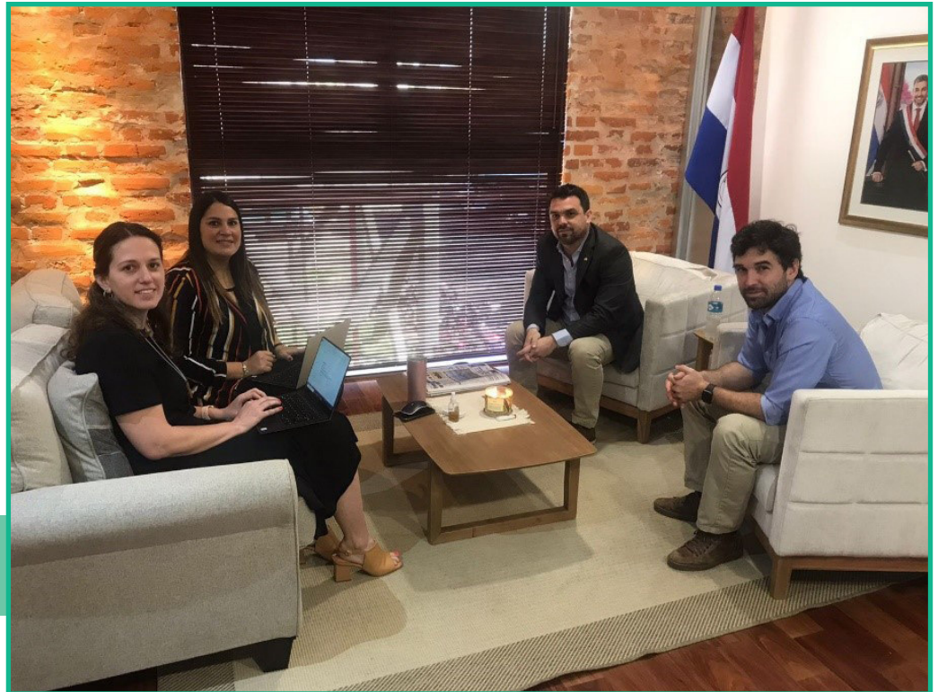
Presentación del trabajo realizado al Ministro y Viceministro 2022-12-20