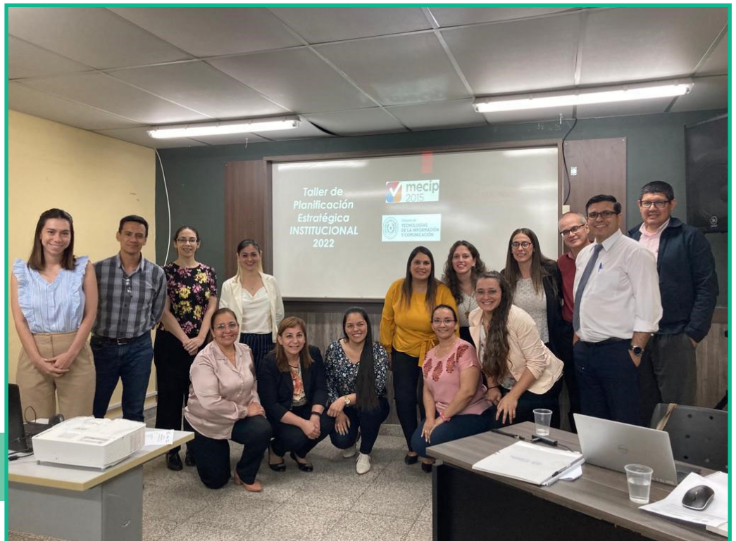
Taller PEI 2022-11