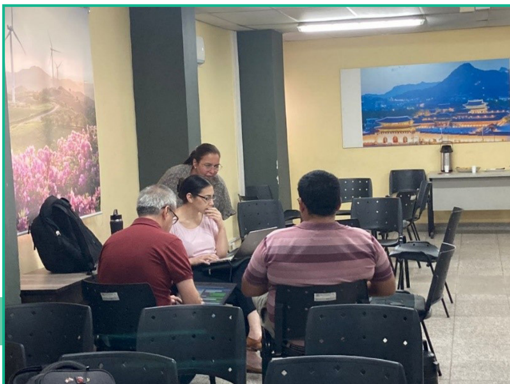
Taller MITIC 2022-12-05