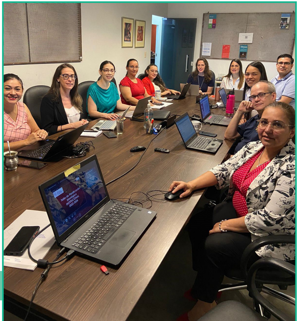
Taller PEI 2022-12