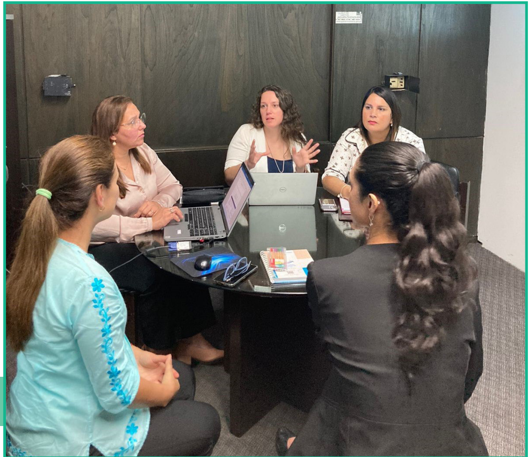
Reunión STP 2022-11-23