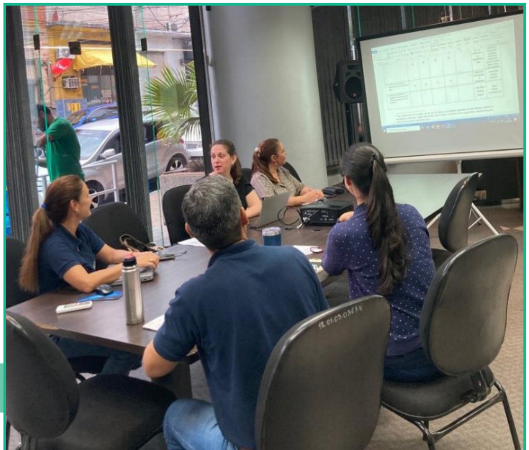
Reunión STP 2022-12-02